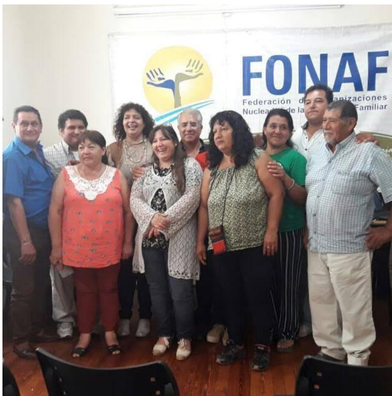
La FONAF fue la responsable de la presentación del amparo